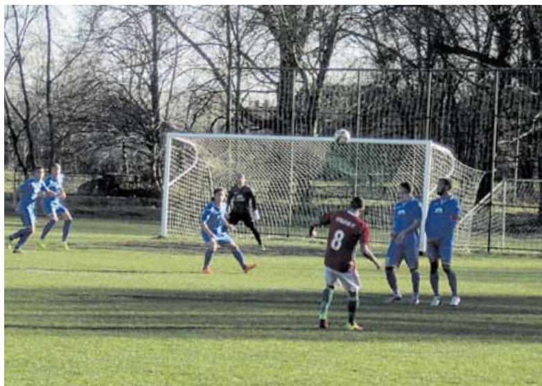
Kemény diónak bizonyult a 'barcikai védelem...