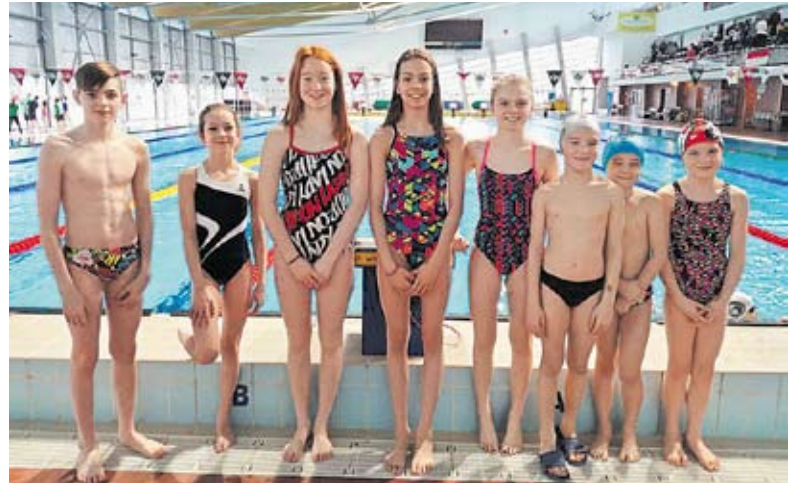
Miskolcon az „A” kategóriások versenye előtt