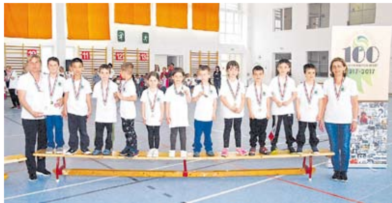
A VI. Oviolimpia is a 100 éves Sport jegyében zajlott. Képünkön a 3. helyezett Nyírbátori Kerekérdő Tagóvoda csapata