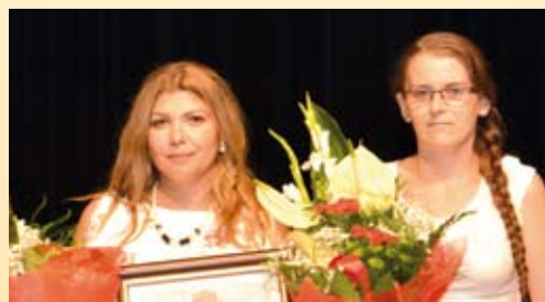
Zhutipe Hátrányos Helyzetűeket Segítő Alapítvány