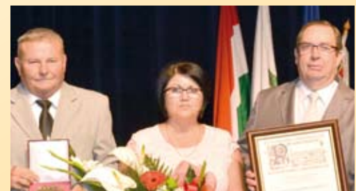
Egyenlő Esélyért Egyesület