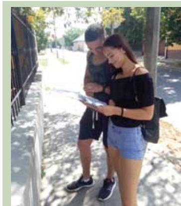
Izgalmas, nyomozós túrra helyszíne volt augusztus 4-én Nyírbátor. /2.

Sajnos keringenek orvosilag alá nem támasztott mendemondák, butaságok a közösségi oldalakon a „gyógyító” hatásairól, de erről talán kérdezzük meg inkább azokat, akiknek július végétől egészen az első fagyokig megkeseríti az életét az allergia, amelyből egy idő után asztma alakul ki. A betegek száma évről évre emelkedik, ma már két millióan szenvednek a parlagfű pollenjétől, vagyis minden ötödik(!) ember, ami azt jelenti, lassan nincs olyan magyar család, amelyik ne lenne érintett. Ha ez még nem lenne elég figyelemfelkeltő: aki nem védekezik a parlagfű ellen, 15 000 forinttól 5 millió forintig terjedő bírságra számíthat a fertőzött terület nagyságától függően.