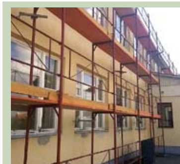
Elkezdődött a zeneiskola felújítása, melynek 70 százalékát pályázati forrásból 30 százalékát önkormányzati saját forrásból finanszírozza a város. /2.