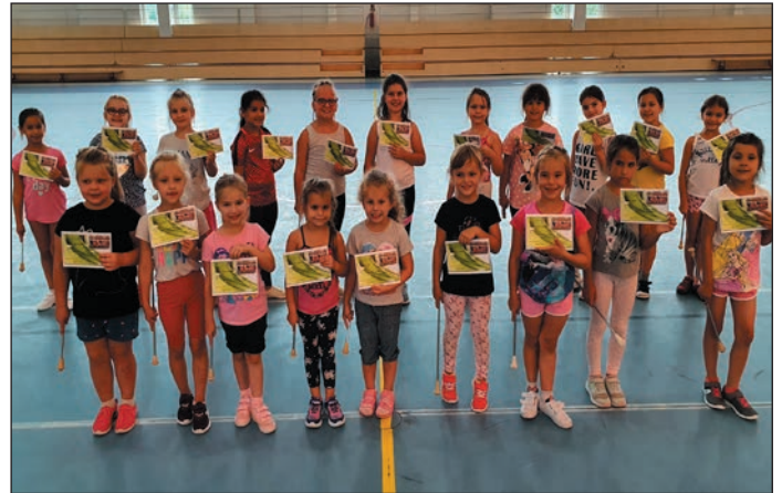
Botforgató mazsorett táborban a legkisebbek

A Nyírbátori Labdarúgó SE augusztusi kupamérkőzésén, a félidőben műsorunkkal sikerült ösztönöznünk a hazai csapatot a győzelemre.