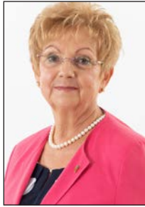
Balla Jánosné 3.sz.vk. NYJE-MSZP- PÁRBESZÉD- MOMENTUM- ÖSSZEFOGÁS MEGYÉNKÉRT-DK.

Sikerekben gazdag, boldog új évet kívánok a város minden lakójának!