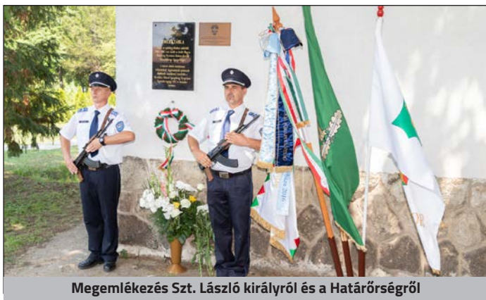
Megemlékezés Szt. László királyról és a Határőrsegről

Fontos feladatunknak tekintettük, hogy részt vegyünk városunk önkormányzata, valamint a Kulturális Központ által szervezett rendezvényeken.