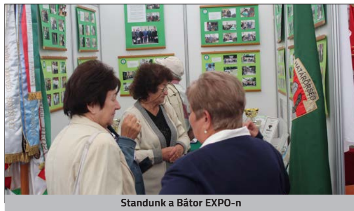
Standunk a Bátor EXPO-n

Évek óta részesei vagyunk azoknak az akcióknak, kezdeményezéseknek, amelyek városunk rászoruló lakosainak