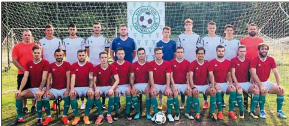
A csapatunk, amely elkezdte a bajnoki szezont

Jelen pillanatban Nyírbátorban megszűnt létezni a Nyírbátori FC, a Nyírbátori Labdarúgás Kft., nincs az NB-III. osztályba nevezhető csapatunk, nem nevezhetjük a bajnokságokba az utánpótlás csa-