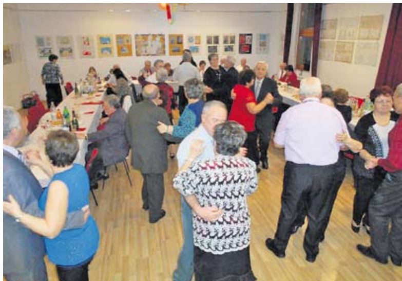
Önfelelt mulatozás az Óév-búcsúztatón