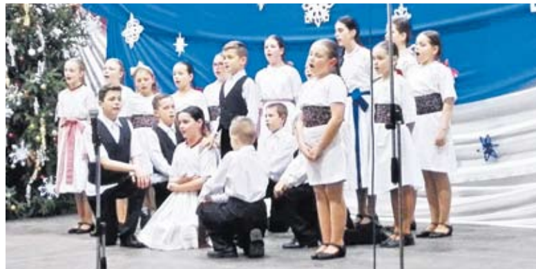
Pántlika néptáncsoport műsora

pillanata az iskolai karácsonyi ünnepély. Intézményünk mind alsó, mind felső tagozatos diákjai és tanárai heteken keresztül lelkesen készülődtek erre az estére, hogy örömteli pillanatokot szerezzenek egymásnak és szeretteiknek.