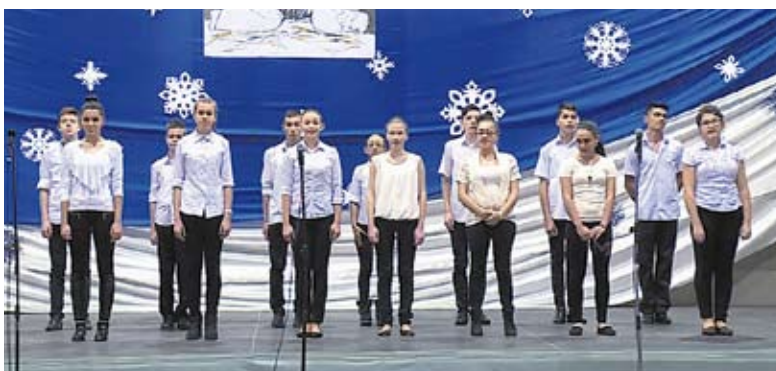
A 8.c osztály ünnepi pillanatai