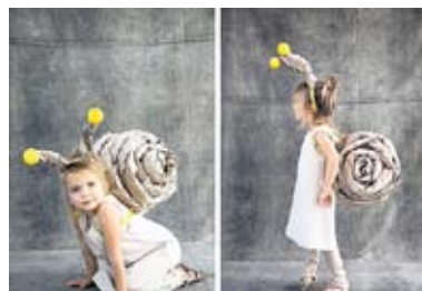
Csiga-biga egy vékony takaró által...

Közeledik a február. Anyukák és nagykik sokasága töri már most is a fejét, hogy mi legyen a gyerkőc az idei farsangon, különösen, ha a bálon díjazzák a saját készítésű, egyedi ötleteken alapuló jelmezeket. Sandán pislognak a varródobozra, remélve, hogy nem kell vele éjszakázniuk az elkövetkezendő néhány hétben. Adunk néhány ötletet, a könnyen és gyorsan elkészíthető jelmezek kategóriájában, arra vonatkozólag, hogy milyen egyszerű és kézenfekvő elkészíteni otthon a