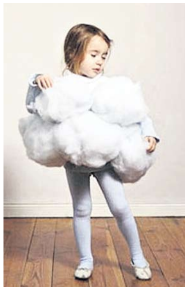
Néhány csomag vatta segítségével felhőcske...

szekrény mélyén, vagy a fiókba rejtőző anyagokból, tárgyakkól egy-egy kifejezetten egyedi és ötletes farsangi jelmezt.