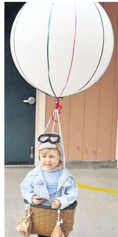
Ha meg a fellegekbe vágysz és még egy lyukas kosár is kéznél van, fújjatok fel egy lufit és változz hőlégballonná