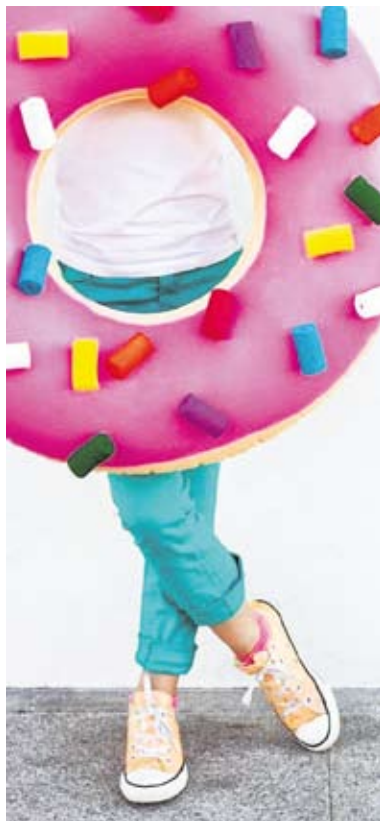
Légy fánk, csak egy úszógumi kell hozzá...