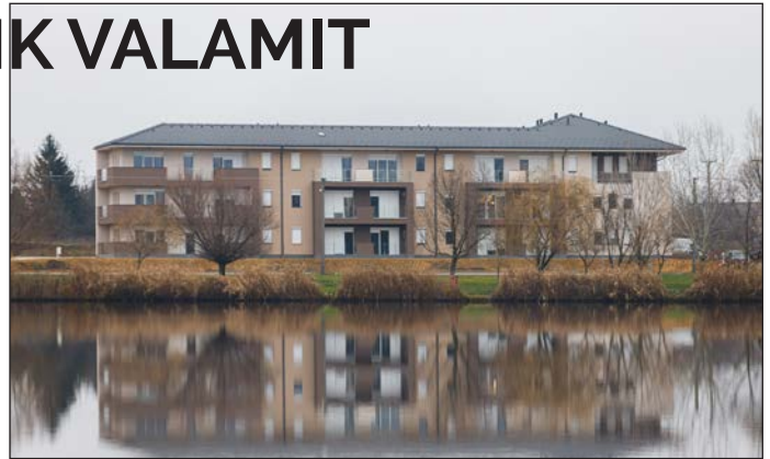
2020 Új önkormányzati bérlakások épültek a Szénaréten