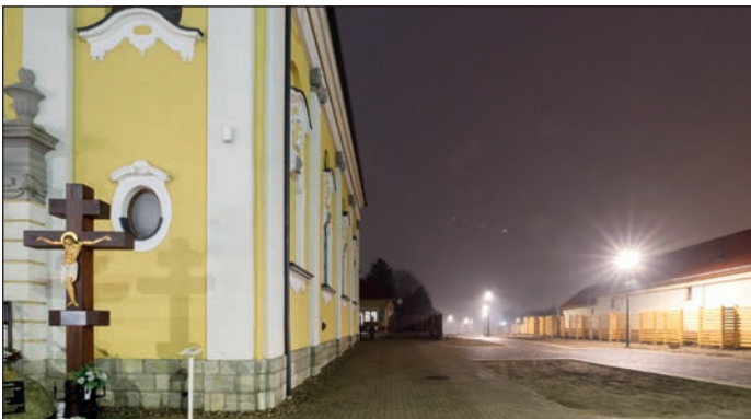
A város történelmi sétány bővítése régóta várt eleme a városközpont fejlesztésének. A sétány folytatásával összeköttöttük a görögkatolikus templomot, a tavat, a felújítás alatt álló múzeumot és az új görögkatolikus bölcsődét.