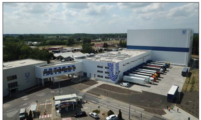
2022 Új nyolcezer négyzetméteres készáru-magasraktár csarnokkal bővült az Unilever