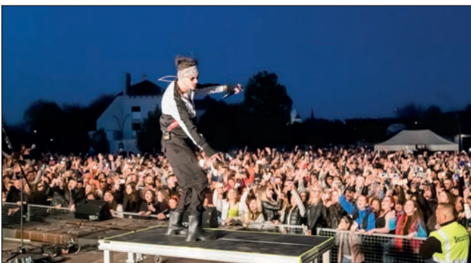
Számos rendezvénnyel, programmal ünnepeltük a város 50. jubileumi születésnapját. Olyan eseményeket szerveztünk, ahol a város teljes lakossága ünnepelhetett.