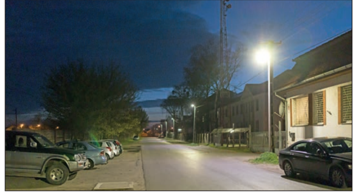
Az energiahatékonyság és közbiztonság jegyében a város 300 millió forint saját forrásból felújítja a közvilágítást, és a legtöbb intézményre napelemes rendszert telepített.