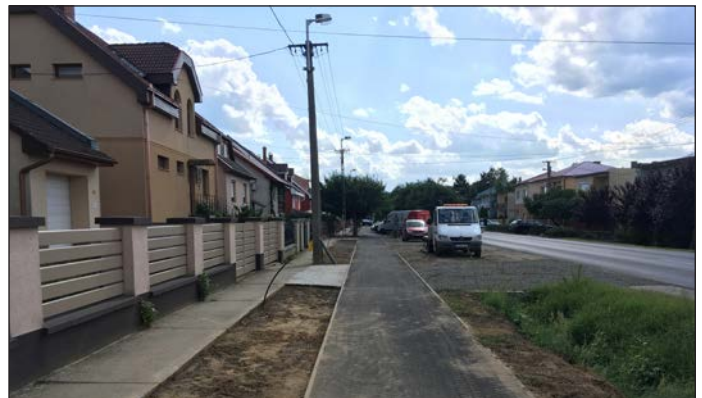
2021 Elkészültek az új kerékpárutak a Damjanich, Édesanyák, Fáy, Ipari Park és Debreceni utakon