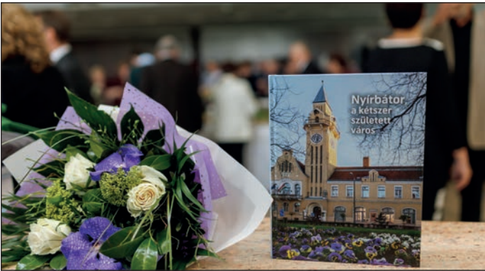
A város elmúlt 50 éve előtt tisztelegve a képviselő-testület számos elismerést és kitüntetést ítél oda, és egy könyvet is készített, amely minden család számára ingyenesen átvethető.