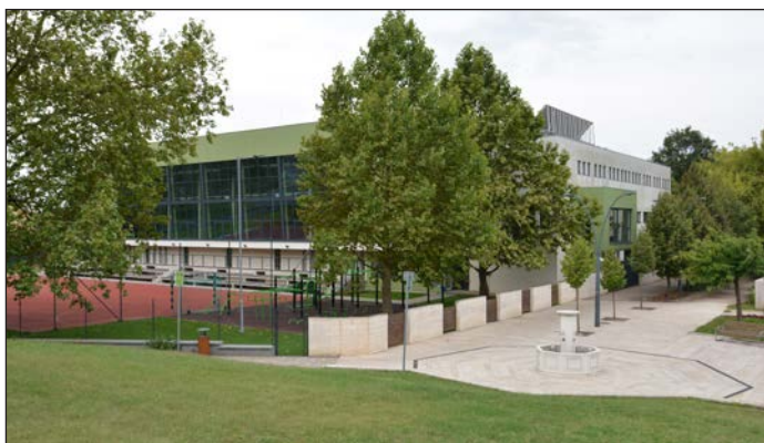
2018 Átadták a Báthory István Katolikus Általános Iskola és Gimnázium új tornacsarnokát