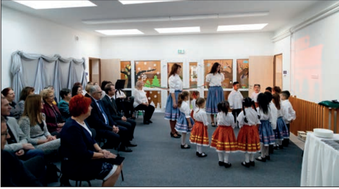
A szülők támogatása, a gyerekek iskolára való felkészítése jelentős változások ment keresztül. 2023-ban a József A. úti óvoda teljes felújítása mellett megépült egy új bölcsőde is.