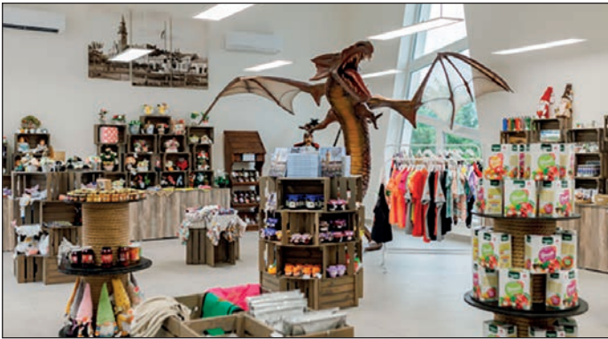
Az új bemutató üzlet lehetőséget nyújt valamennyi helyi termelőnek, kézművesnek, művészeti alkotónak, hogy megmutassa és értékesítse termékeit, a városunkba látogató turistáknak, rokonoknak, barátoknak, üzleti partnereknek.