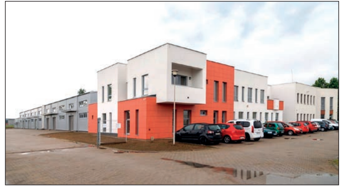
Az ipari park folyamatos bővítése a város gazdasági növekedésének a motorja. A jelentősen bővített inkubátorház helyi vállalkozóknak, fiataloknak biztosít megfelelő környezetet, irodát, raktárt a nagyvállalatok közvetlen környezetében.