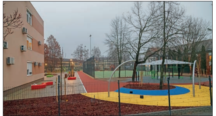
Az oktatás folyamatosan fejlődik Nyírbátorban. Idén a Báthori Anna Református Iskola esett át jelentős fejlesztésen.

KÖSZÖNJÜK a városban működő gazdasági társaságoknak, vállalkozóknak, civil szervezeteknek és magánszemélyeknek az anyagi támogatást, amelynek köszönhetően 300 rászoruló nyírbátori családnak több millió Ft-ból tudtunk adománycsomagokat összeállítani, ezáltal szebbé tenni az ünnepeket.