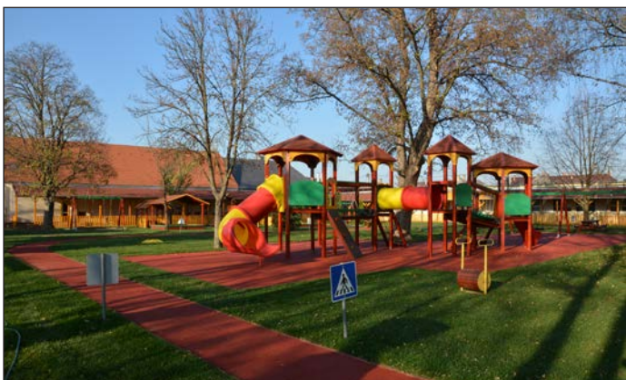
2019 A Kerekerdő óvoda felújítása, bővítése

Folytatjuk, egyben be is fejezzük Nyírbátor második várossá válása alkalmából indított sorozatunkat, melyben az elmúlt öt évtized kiemelkedő fejlesztéseit, eseményeit vettük számba.