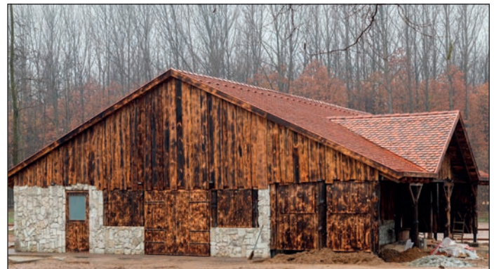
Több turisztikai fejlesztés indult el ebben az évben. A lovarda területén új zarándokfogadó és állatsimogató került kialakításra. Emellett folyik a múzeum teljes átépítése, és nyárra elkészül a fürdő turisztikai bővítése.