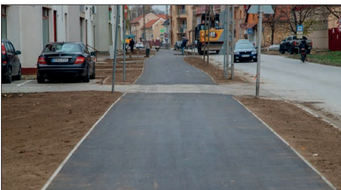
A közlekedés biztonságosabbá tétele fontos szempont, ezért bővítjük a kerékpárhálózatot, felújítjuk a járdákat, lassítjuk az autók sebességét trafiboxokkal, kiemelt gyalogátkelőkkel.