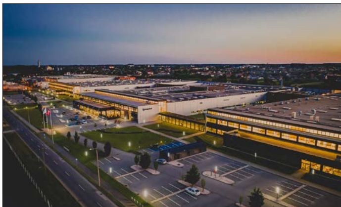
2018 Befejeződött a Coloplast Hungary Kft. fejlesztésének III. üteme