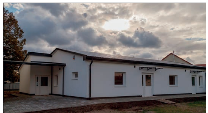
A kultúra és a művészet támogatása jegyében az idei évben az üttérterem bővítése mellett, az akotóházban városi galériát hoztunk létre, amely a „Volt egyszer egy sűdó” című könyv bemutatóján nyílik meg.