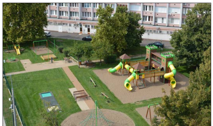
2022 Felújították a Penny játszóteret