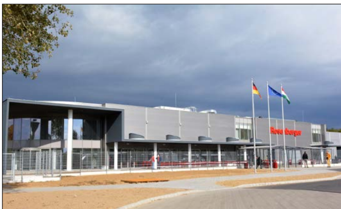
2018 Átadták a Rosenberger Magyarország Kft. nyírbátori, új gyártócsarnokát