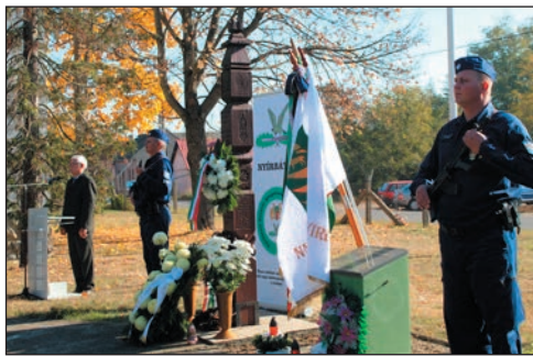
Halottaink emléket őrzi a kopjafa...

Még ugyanezen a napon részt vettünk a Nyírbátor Város Önkormányzata