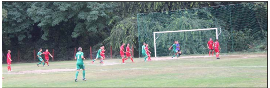
Vaján 6:3 arányú győzelem...

A felnőtt csapat mellett jelentős utánpótlásbázis kialakítása történt meg. Bajnoki rendszerben versenyeznek az U-14 és az U-16 korosztályos csapatok, a „Bozsik program” keretében pedig pályára lépnek az U-7, U-9, U-11 és U-13 korosztályt képviselő csapatok is.