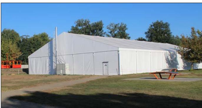
Télen is kiváló feltételek állnak rendelkezésre a fedett pályán

Részletes feltételekről érdeklődhethet a 0670/362-1957-es telefonszámon civusneveloszuloihalozat@gmail.com e-mail címen, vagy honlapunkon, a www.civishn.hu oldalon.