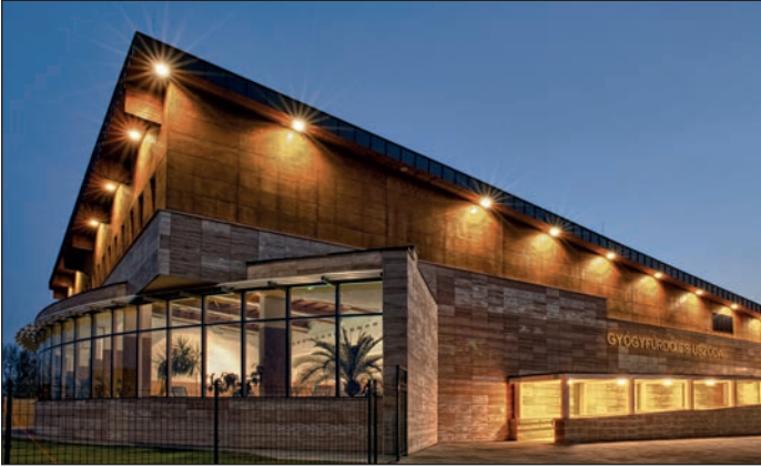
2010 Átadták a Sárkány Wellness és Gyógyfürdőt 2010 Befejeződött Kemping teljes átépítése