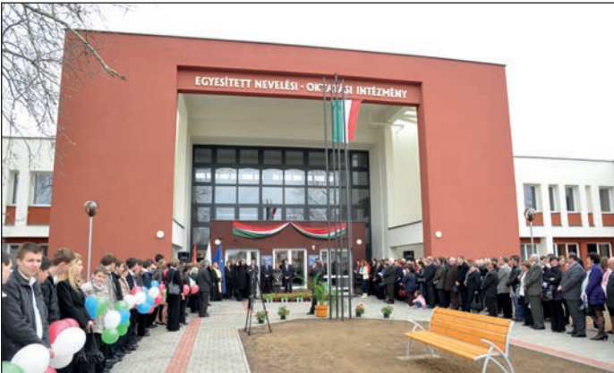
2010 Az Oktatási Centrumot felújították, tornacsarnok épült és kezdetét vette a kéttannyelvű oktatás 2010 Edzőközpontot alakítottak ki az asztaliteniszezőknek 2010 Átadták az új fogorvosi rendelőket 2010 Farmol Hungary Kft. megkezdte termelését a városban 2010 Megnyílt a TESCO nyírbátori áruháza