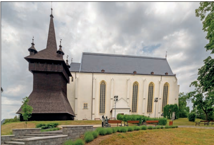
2011 Felújították a Református templomot 2011 Megépült az első kerékpárút a városban 2011 A Bölcsőde felújítása befejeződött 2011 Átadták az Inkubátorház és Szolgáltató Központot 2012 Befejeződött a Fáy utcai óvoda felújítása és bővítése 2012 A Diehl cégcsoport elindította működését Nyírbátorban 2012 A Református Egyház átvette a Hunyadi Mátyás Általános Iskola fenntartását 2013 A Báthory István Gimnázium a Debrecen-Nyíregyházi Egyházmegye fenntartásába került