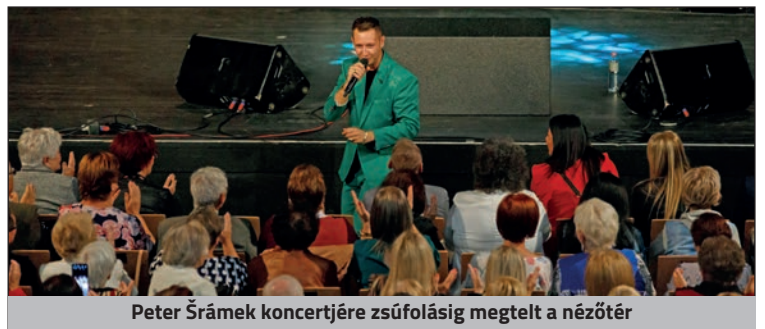
Peter Šrámek koncertjére zsúfolásig megtelt a nézőtér

Több helyen is köszöntötték a szépkorúakat Nyírbátorban. A legnagyobb rendezvényként a zene világnapjával közösen az idősek világnapjának zenés ünnepét, a nagy sikerű Peter Šrámek koncertet említhetjük, amelyet a Művelődési Központban szerveztek meg október 5-én. Ez alkalommal is megerősítette Máté Antal polgármester, hogy Nyírbátorban különös figyelmet fordítanak az idősekre és a különféle szervezeteik közreműködésével erőteljesen érvényesítik az idősek elvárásait, illetve kívánságait. Éppen ezért hozták létre a városban az Idősügyi Kerekasztalt is.