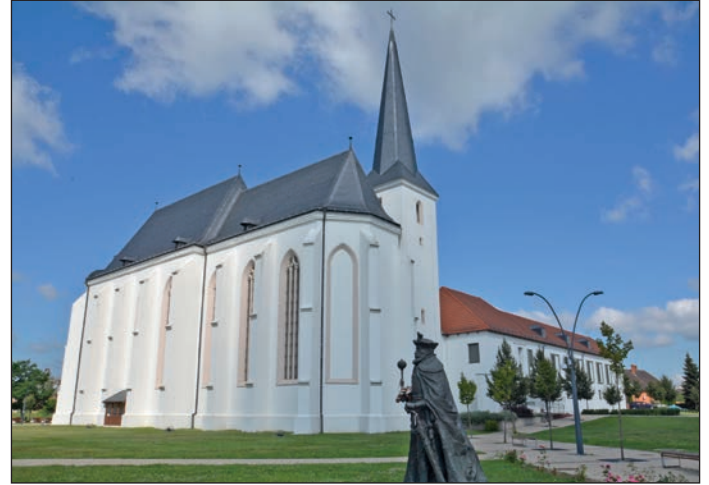
2011 Befejeződött a Minorita templom teljes felújítása