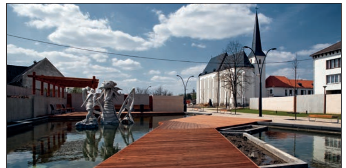
2011 Átadták a Várostopörténeti sétányt 2013 2013. január 1-től közel 300 hatáskör került át az önkormányzattól a járási hivatal hatáskörébe