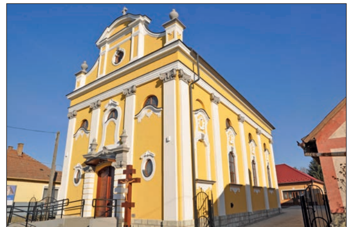
2013 Befejeződött a Görögkatolikus templom felújítása