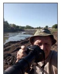
Kép és szöveg: Tanyik József

De aztán megbékéltek, és a reggelizni, vacsorára érkező fekete gólyapárt h a n y a g eleganciával tűrik meg.