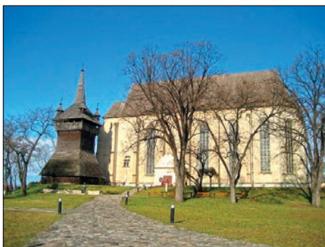
A város református temploma, melynek harangját 1640-ben öntötték Eperjesen

7.a Báthory Anna Református Általános Iskola és Óvoda