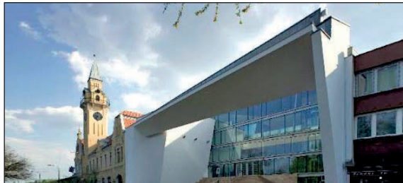
Nyírbátor Kulturális Központja, mely 2006. április 20-án nyitotta meg kapuit

szaki hivatala a modern városrendezés előharcosa. Az ő munkájuknak köszönhetően alakultak ki a gyermekek újszerű, modern, veszélytelen játszóhelyei, amelynek ideg-