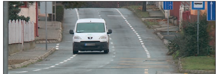
Az úttesten fehér szaggatott vonal jelzi a nyitott kerékpársávot

kaszra vonatkozik. A nyitott kerékpársávra a gépkocsivezetők rámehetnek, de csakis akkor, ha indokolt, például előzés, kikerülés vagy kitérés esetében. A nyitott kerékpársáv szabályai vonatkoznak a Madách tértől az Édesanyák útja – Vár utca kereszteződésig vezető úttestre is.