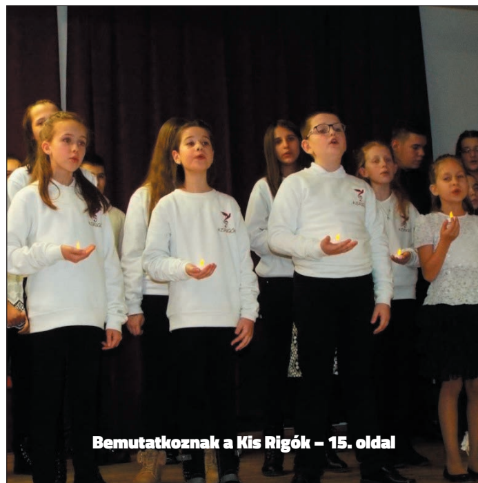
Bemutatkoznak a Kis Rigók – 15. oldal