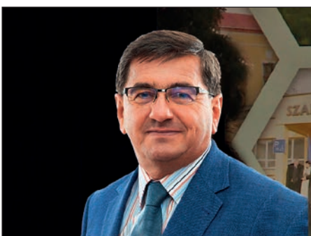
Veres János volt pénzügyminiszter