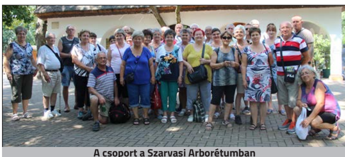
A csoport a Szarvasi Arborétumban

Az első napon Gyomaendrődön néztünk körül, ahol a Kner Múzeum, a tájház, valamint a „Bárka” látogatóközpont nyújtott maradandó élményeket. Orosházán bekvártélyoztuk magunkat a „Táncscs” kollégiumba, ahol felkészülhettünk a következő napi programra, nevezetesen a Szarvasi Arborétum, azon belül is a „mini Magyarország” megtekintésére, valamint a sétahajózásra.