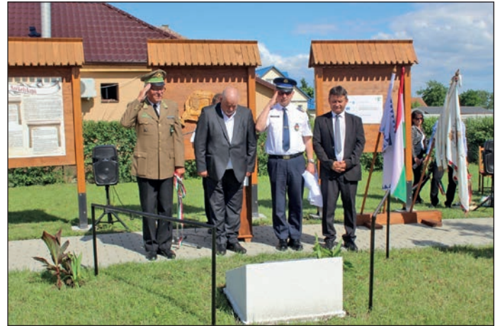
Tisztelgés a leleplezett emléktábla előtt.

A rendezvényen képviseltették magukat Nyírbátor Város Önkormányzata, a Szabolcs-Szatmár-Bereg Vármegyei Rendőr-főkapitányság, a Nyírbátori Vá-