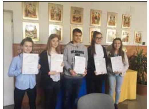
Angol nyelvi triatlon verseny díjátadóján

Az Országos Komplex Természettudományi Verseny döntőjébe két csapa-