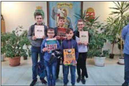
Díjazottak a Megyehatármenti matematika versenyen

A nyíregyházi Túróczy Zoltán Általános Iskola USA Activity Day angol nyelvi