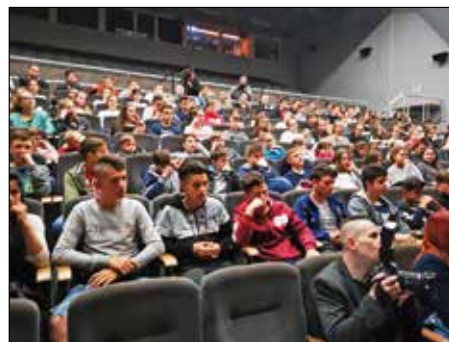
Szép számú közönség töltötte meg a színházterem alsó karéját...

Életútjuk felidézésével, példájukkal erősítették az iskolák, a fiatal generációk, a sportszerető közvélemény felé az olyan értékeket, mint a hazaszeretet, a céltudatosság, az elkötelezettség, a csapatspiritus, a teljesítmény orientáltság, a tanulás iránti elkötelezettség, a kitartás és a szorgalom, nem utolsósorban pedig a fair play szellemét.